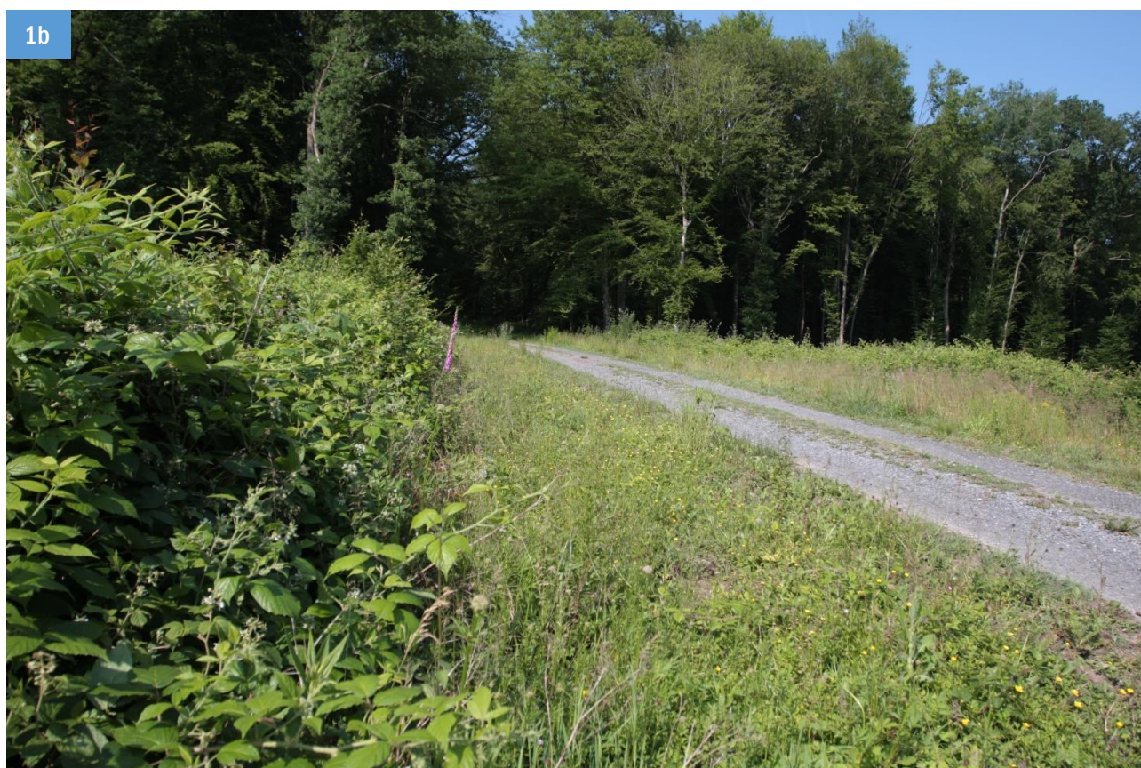
Figure 1. Principaux types de milieux prospectés. 1a - Bord de route secondaire dans le bocage, commune de Watigny (La Fosse aux loups), ancienne voie de chemin de fer macadamisée. 1b - Bord de chemin forestier, commune de Saint-Michel en Thiérache, (Route des Faux), aperçu après une coupe à blanc sur une petite parcelle.