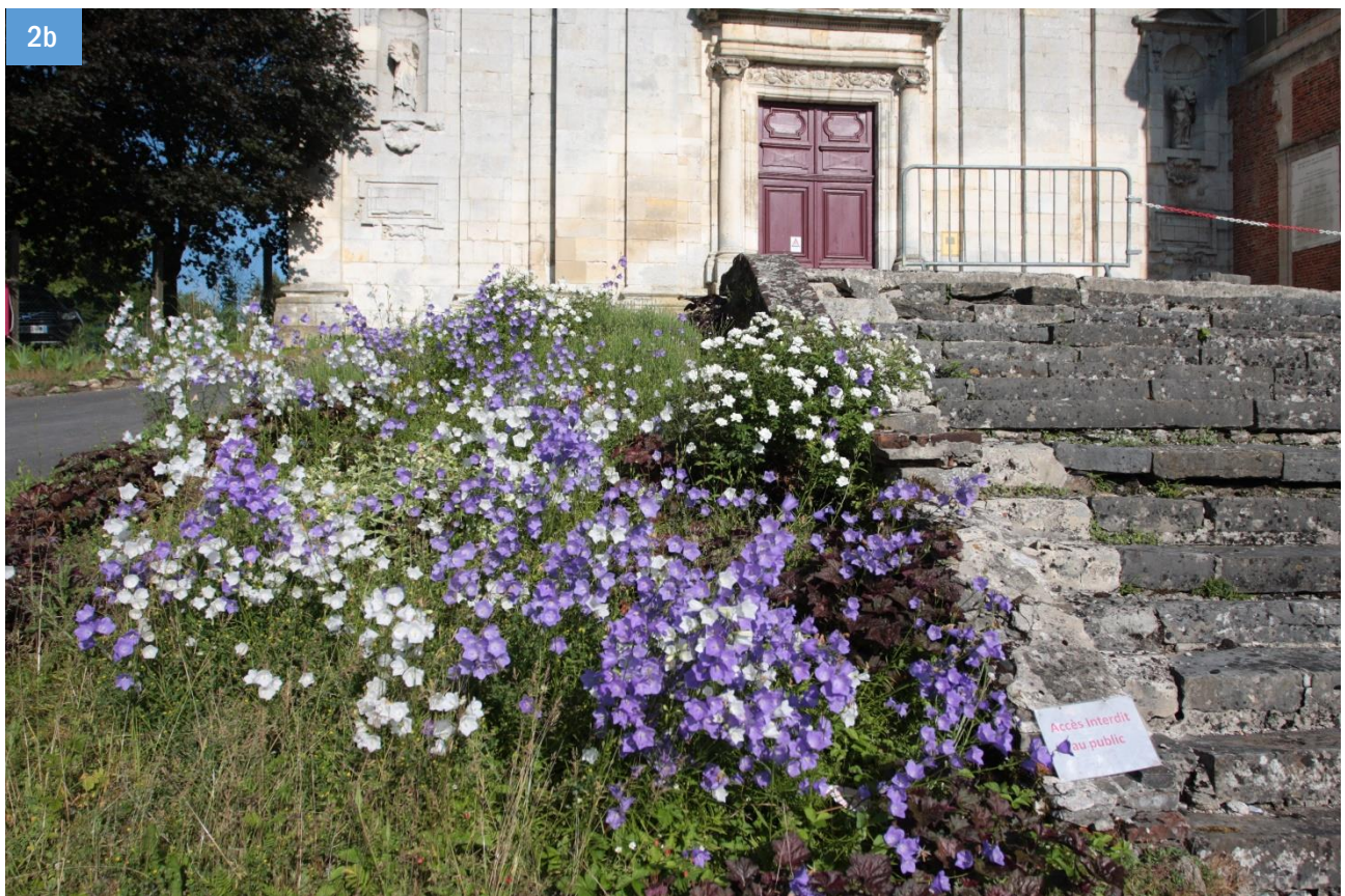
Figure 2. Types de milieux occasionnellement prospectés. 2a - Prairie bocagère, commune de Watigny (la Forge de Saily), milieu riche en chardon à proximité de la rivière Le Gland. 2b - Massif fleuri de plante horticole du genre Campanula , abord de l'abbaye de Saint-Michel en Thiérache.